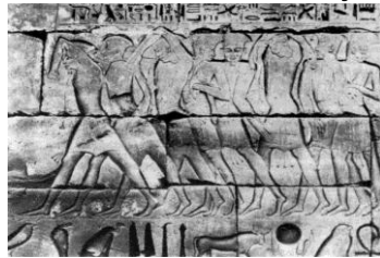
Afbeelding van Peleset (Filistijnen) in Medinet Haboe