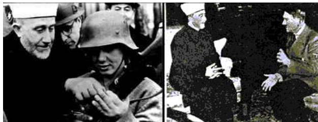
Husseini with Nazi soldiers and Hitler